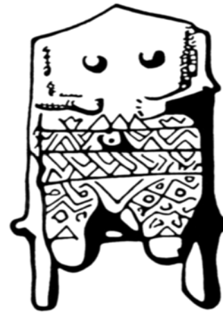
A termékenység istennőjének edény szobra. Hódmezővásárhely, Kőkény-domb. (ásta: Banner János)

A primitív ember tevékenykedése mindig valami szükségyszerűségből következett. Az őskor embere a rajzolást is szükségből alkalmazta. A rajznak varázserőt tulajdonított és az állatot, melyre vadászott, lerajzolta, hogy ezáltal megidézze, megbűvölje és megejtse. A vadászszerszözökre vésett állatrajzokkal az ábrázolt állatok erejét igyekezett kisebbíteni, vagy gyorsaságukat hajítódárdája számára megnyerni.