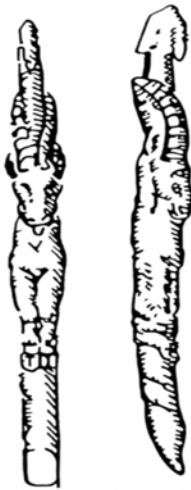
Hajítódárda zergeábrázolással. Magdalénien (rénszarvas-kor)

Az ábrázoló hajlam körülbelül az embernek értelmi lényge való alakulásával veszi kezdetét. A holland Huizinga szerint a művészet az ember játkos ösztönéből származik (Homo ludens). Valószínűbb azonban, hogy reálisabb szükségyszerűség indította útjára. A primitív ember gyakorlati érzéke sokkal erősebb, mint a kultúrálté. Azonkívül, az ősember a természettel, annak ismeretlen jelenségeivel vívott küzdelmet, élelmének veszélyekkel járó megszerzése, tűzhelyének és éjjeli szállásának védelme, mind súlyos feladatokat rótt rá. Azok a művek, melyek e korból fennmaradtak, mind használati tárgyakkal kapcsolatosak. Nyílhegyezőre karcolt vadlovak, zerge ábrákkal díszített hajítódárdák, emberformájú agyagedények stb. Csontra vagy agyagtárgyakra, edényekre karcolt vagy festett geometrikus formák, körök, háromszögek, mind valami jelentőséggel bírtak az akkori ember számára.